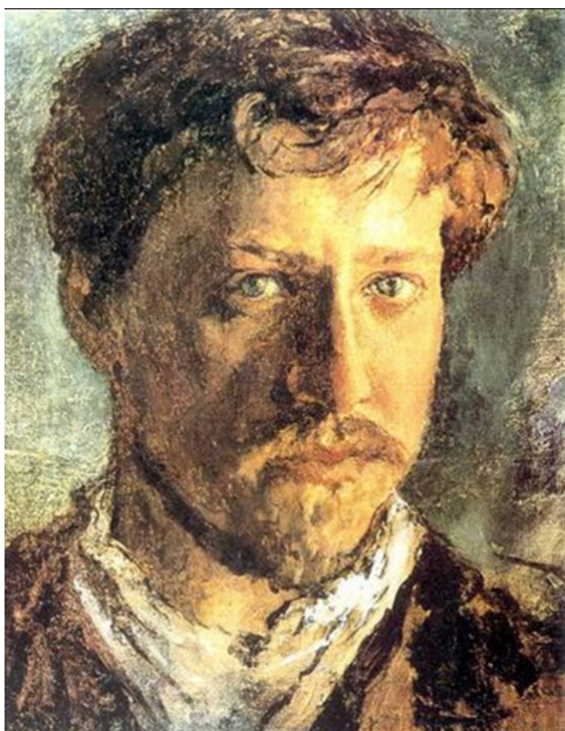
Автопортрет, В. А. Серов, 1880-е

Он отличался необыкновенной деликатностью по отношению ко всем, с кем приходил в соприкосновение; случайно обидев кого-нибудь, долго мучился от сознания причиненной другому неприятности, и тем не менее его боялись. Боялись и любили.