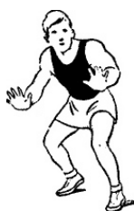
Рис. 7. Стойка защитника

В третьем случае одна рука поднята вверх, чтобы помешать броску в корзину, а вторая опущена вниз, чтобы помешать ведению мяча (рис. 8, 3).